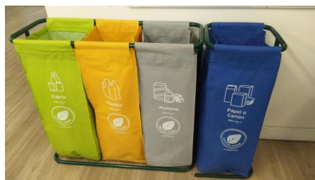
Figura 1. Contenedores de reciclaje OFV

Las oficinas participantes del Programa Oficina Verde pueden optar por realizar reciclaje de residuos al interior de su espacio de trabajo, a través de contenedores autogestionados o entregados por la Dirección de Sustentabilidad. Estos últimos se componen de un set de eco bolsas rotuladas para la separación de papel, plástico, aluminio y vidrio (Figura 1).