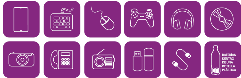
Figura 4. Elementos reciclables en Campana RAEE

La campana recibe aparatos eléctricos y electrónicos menores: celulares, tablets, notebooks, routers, reproductores de audio, calculadoras, GPS, reproductores mp3 y mp4, cargadores, cables, teclados, mouses y otros componentes periféricos de computación, tostadores, herramientas eléctricas, secadores de pelo, radios, videocámaras, y pilas y baterías, estas últimas dentro de botellas plásticas con tapa ( Se excluyen baterías de vehículos motorizados y similares ). Para conocer la ubicación de la Campana RAEE revisar el Anexo.