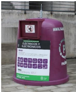
Figura 3. Campana RAEE

Los artículos eléctricos y electrónicos pueden ser depositados durante todo el año en las Campanas para el Reciclaje de Artículos Eléctricos y Electrónicos (RAEE) (Figuras 3 y 4).